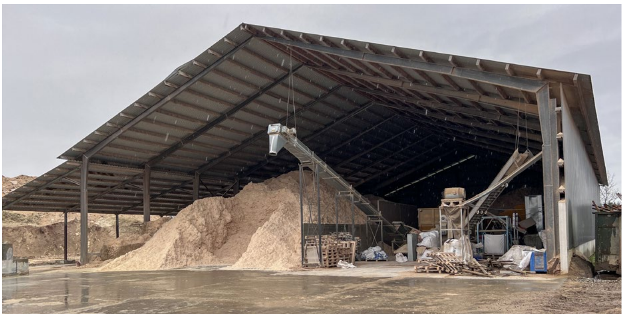
De faciliteit van North Trade House.